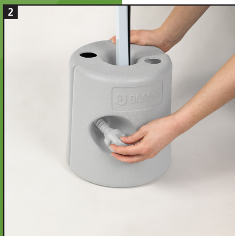
2. Mit Schrauben verbinden.