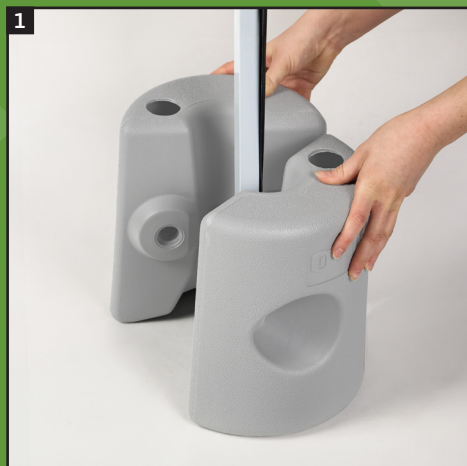
1. Pavillonstange einspannen.