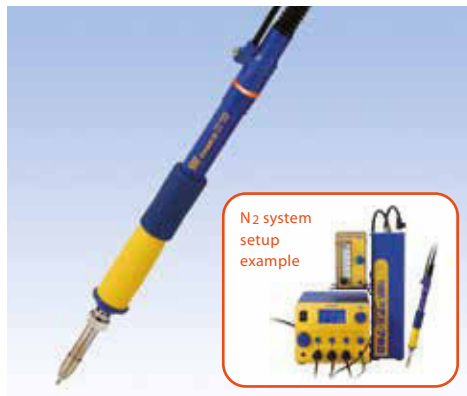
N 2 StickstofflötKolben