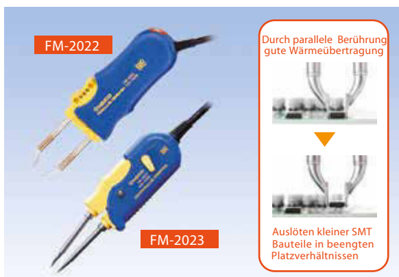
SMD Löt- Entlötpinzetten